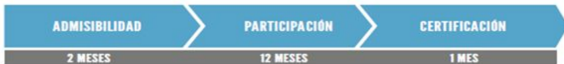
Gráfico 1: Proceso Acuerdos Voluntarios Preinversión (AVP)

El proceso de participación temprana se desarrolló según las etapas definidas en el protocolo operativo del Acuerdo Voluntario de Preinversión..