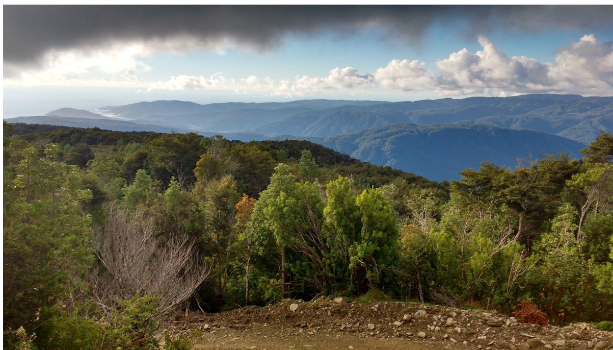
Mirador Huellehue, Río Negro, Región de Los Lagos 1