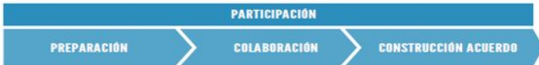
Gráfico 2: Proceso AVP: Detalle proceso participación

Posterior a la admisibilidad, donde se levantaron las condiciones para llevar a cabo o no el proceso de participación, se conformó el Equipo de Trabajo (ET), responsable de llevar a cabo la Etapa de Participación.